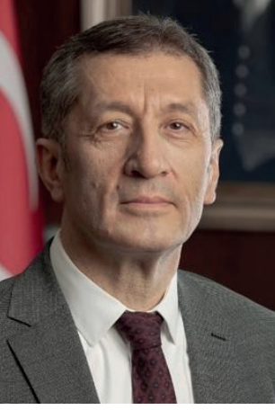
Ziya Selçuk Millî Eğitim Bakanı